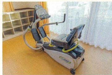
●筋力トレーニングマシン